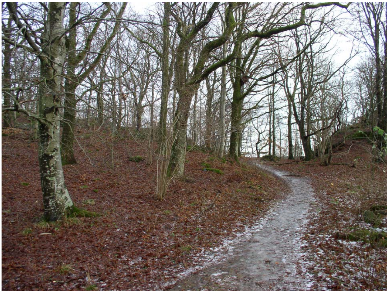
Närströvsområde vid Munkegårde i Kungälv

beskriver anledningen till valet av områden. Av denna anledning finns följande åtgärd med i naturvårds- och friluftslivsplanens åtgärdsplan: ”Utarbeta en åtgärdsplan för definiering och säkerställande av närströvsområden.”. I planen anges följande motivation: De angivna närströvsområdena är till största delen oreglerade och i många fall privatägda. De hot som finns mot områdena är framförallt att omfattande avverkningar kan spolia viktiga områden och att områden kan komma att aktualiseras för byggnation. En plan bör tas fram som värderar de olika områdena med hänsyn till den vikt de har för friluftslivet, samt gör en prioritering av vilka åtgärder som är viktigast för säkerställande