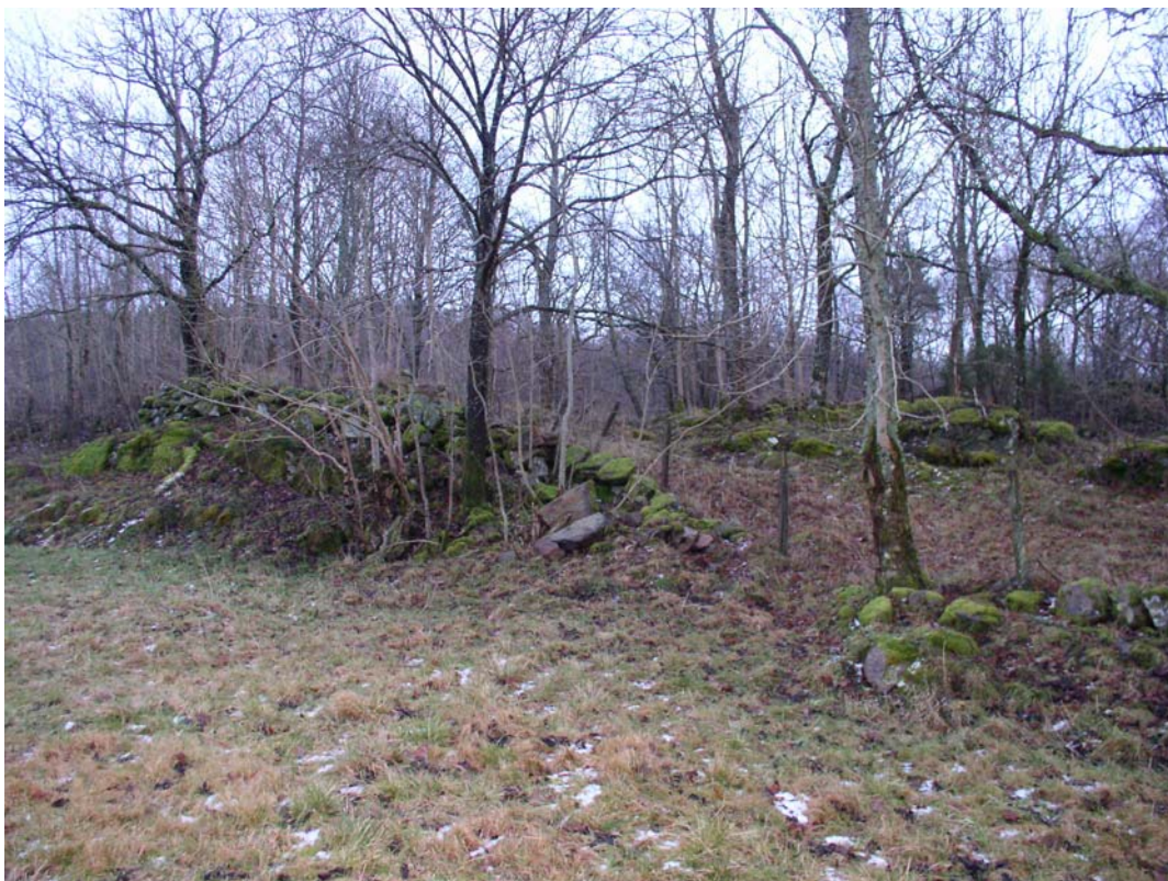
I odlingslandskapet vid Trankärr finns många miljöer som inbjuder till en utflykt med fikakorgen.

terande underlag i bedömningen om hänsynskrav vid anspråk på intrång i dessa områden.