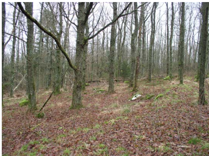
Ekskog vid Ullstorp.

Särklassigt störst effekt skulle en minskning av trafikbruset ha, men i flera områden finns också andra viktiga åtgärder att vidta, t.ex. för att öka lövinslag, skapa utsiktsplatser eller återge en tydligare öppenhet i kulturlandskapet.