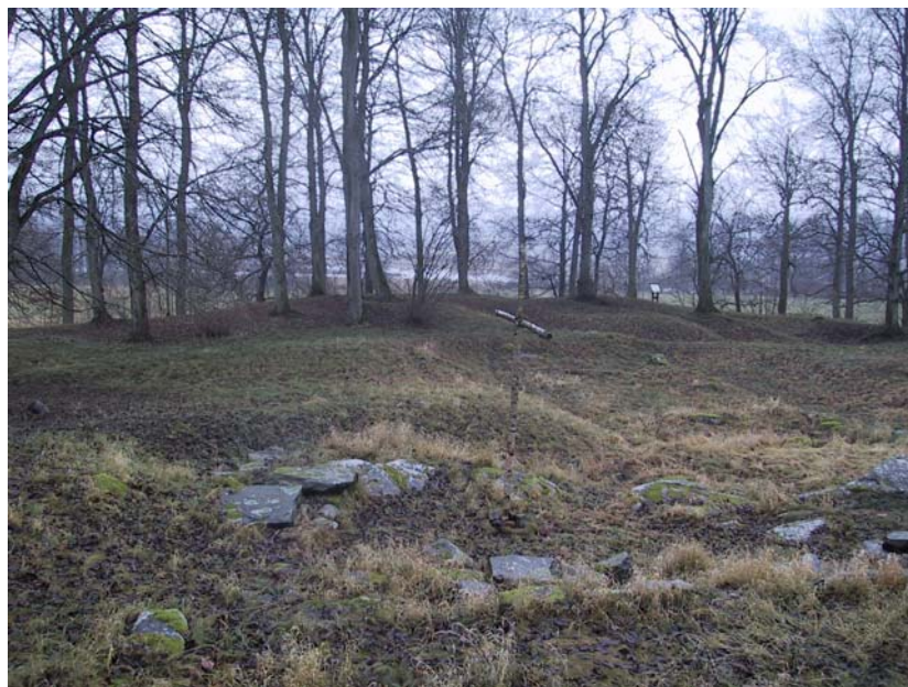
Klosterkullen utgör en målpunkt för utflykter vid Nordre älv.

Behov finns av fler besöks-parkeringsplatser i anslutning till området.