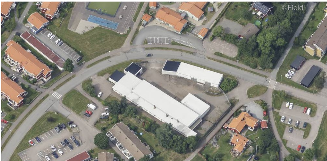
Bild 1. Vy över planområdet idag (vita byggnader i mitten av bilden).

Planområdet är beläget längs Helgonagatan i stadsdelen Munkegårde i Kungälv och omfattar fastigheten Gaffelkremlan 1 samt del av fastigheten Munkegårde 1:1. Befintlig bebyggelse inom planområdet utgörs av industribyggnader.